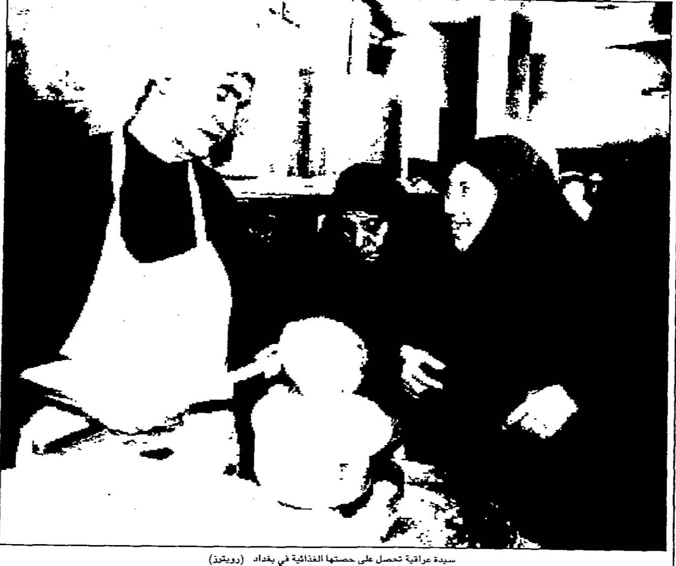
سيدة عراقية تحمل على صحتها الغذائية في بغداد

الامم المتحدة - من انطوني غودمان: يحذر مشروع قرار توضع بريطانيا على اعضاء مجلس الامن العراقي من «اوخم العواقب» اذا انتهك التزاماته بعدم وضع قذافي في محفل مفتشي الاسلحة الدوليين للمواقع التي يشتبهون بوجود اسلحة محظورة بها. وقدمت مسودة مكررة للمشروع حصلت عليها بريطانيا والولايات المتحدة وفرنسا وروسيا والصين واليابان والولايات المتحدة وبريطانيا بقوة كبيرة في الخليلج رغم ما يبدو انه سبب رفض العراق دخول المفتشين الدوليين ما يسمى بمواقع التفتيش. وبدأ الانقراض بعد ان زار كوفي في اثنان من الامم المتحدة لطلبه بخذافه ووقع اتفاق مع العراق لفتح تلك المواقع. ولم يتضح بعد موعد التصويت على مشروع القرار لكن في ضوء المشاورات المستمرة يبدو من المرجح ان يتم التصويت الاسرع المقبل. ومن المتوقع ان تنضم الولايات المتحدة وعضوا اخرون بالمجلس الى بريطانيا في رعاية مشروع القرار. وتعزز العراق سيؤيد مشروع القرار اعتمادا على الخلل في دفع الضغوطات المترتبة على بغداد بمجرّد الاتفاق على العراق وفي كل من عمليات تزج السلاح الواردة في قرار واطلاق النار في حرب الخليج عام 1991. وسيعبر مشروع القرار عن التقدير